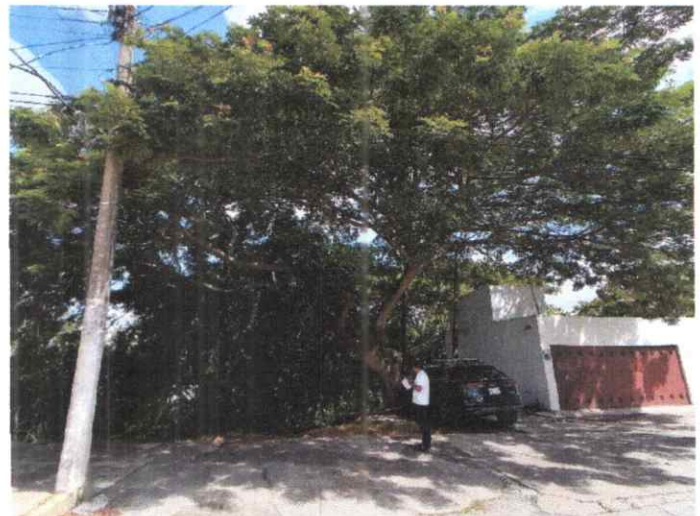
Figura 2.- Las ramas del árbol Saman obstruyen el cableado eléctrico, en la calle Macuspana en Frente a la casa 127. A orilla de la laguna.